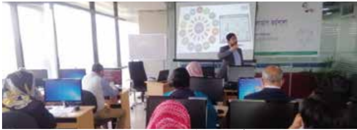
‘ক্ষুদ্র ও মাঝারি শিল্প উদ্যোক্তাদের জন্য ই-কমার্স’ ফলোআপ অনুষ্ঠানে উদ্যোক্তাগণ

ক্ষুদ্র ও মাঝারি শিল্পের উদ্যোক্তাদের অনলাইন ব্যবসা বা ই-কমার্সে সক্ষমতা অর্জনে এসএমই ফাউন্ডেশন কয়েক বছর যাবত কাজ করছে। এরই ধারাবাহিকতায় ফাউন্ডেশন ঢাকাসহ বিভাগীয় পর্যায়ে এসএমই উদ্যোক্তাদের জন্য ই-কমার্স ও ই-মার্কেটিং সম্পর্কিত প্রশিক্ষণ কার্যক্রম পরিচালনা করে আসছে। উদ্যোক্তাদের প্রশিক্ষণ পরবর্তী বর্তমান অবস্থা পর্যালোচনা এবং বর্তমান সময়ের প্রয়োজনীয় ও গুরুত্বপূর্ণ অনলাইন ব্যবসায়িক কৌশলসমূহের সাথে পরিচয় করিয়ে দেয়ার উদ্দেশ্যে অক্টোবর ও ডিসেম্বর ২০২১ এ ই-কমার্স বিষয়ক ফলোআপ অনুষ্ঠানের আয়োজন করা হয়। এতে ৬০জন উদ্যোক্তা অংশগ্রহণ করেন।