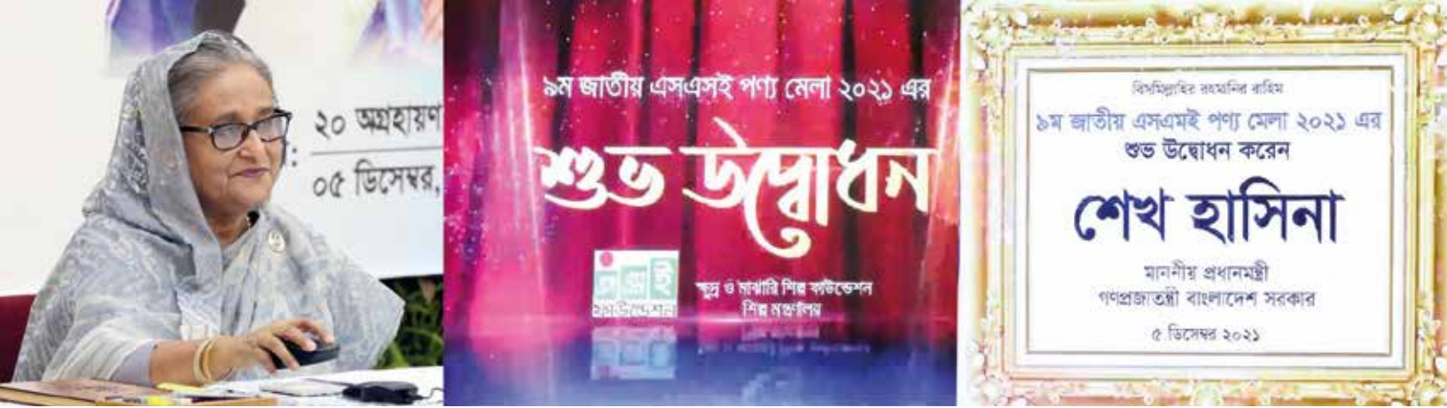
গণভবন থেকে ভার্সুয়ালি ৯ম জাতীয় এসএমই পণ্যমেলা ২০২১ এর উদ্বোধন করেন মাননীয় প্রধানমন্ত্রী শেখ হাসিনা এমপি