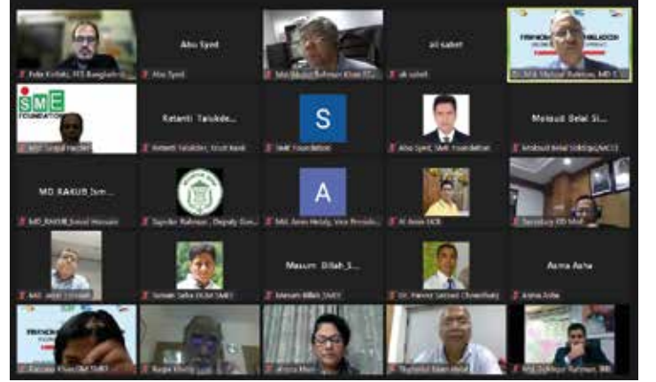
অনলাইনে ‘Financing SMEs in Bangladesh: Lessons from the German Experience’ পলিসি পেপার উপস্থাপন অনুষ্ঠানে অংশগ্রহণকারীদের একাংশ