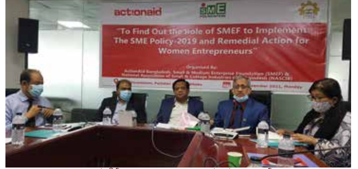
‘এসএমই নীতিমালা ২০১৯ বাস্তবায়নে এসএমই ফাউন্ডেশনের ভূমিকা: নারী-উদ্যোক্তাদের চ্যালেঞ্জ ও প্রতিকার’ সেমিনারে অতিথিবৃন্দ