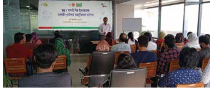
‘অনলাইন মার্কেটপ্লেসের সাথে এসএমই উদ্যোক্তাদের সংযোগ স্থাপন’ কর্মশালায় অংশগ্রহণকারী উদ্যোক্তাগণ

করোনা ভাইরাসের প্রেক্ষাপটে ক্ষুদ্র ও মাঝারি শিল্পের উদ্যোক্তাগণ উৎপাদিত পণ্য বাজারজাতকরণে নানা সমস্যার সম্মুখীন হচ্ছেন। সমস্যা সমাধানে অনলাইন মাধ্যমসমূহ গুরুত্বপূর্ণ ভূমিকা পালন করছে। এসএমই ফাউন্ডেশন উদ্যোক্তাদের ব্যবসা পরিচালনায় আইসিটি ব্যবহারের জন্য বিভিন্ন ধরনের কার্যক্রম পরিচালনা করে আসছে। এর মধ্যে উল্লেখযোগ্য হলো, অনলাইন ব্যবসায় দক্ষতা বৃদ্ধি বিষয়ক কার্যক্রম আয়োজন, যা করোনা পরিস্থিতিতে বহুল প্রশংসিতও হয়েছে। গত কয়েক বছরে অনলাইনে পণ্য কেনাকাটার পরিমাণ কয়েকগুণ বেড়েছে, বিশেষ করে করোনাভাইরাস সংক্রমণের পর অনলাইন মার্কেটপ্লেসসমূহ উদ্যোক্তাদের পণ্য বিপণনে গুরুত্বপূর্ণ সহায়ক ভূমিকা পালন করে আসছে। এসএমই উদ্যোক্তাগণকে অনলাইন মার্কেটপ্লেসসমূহে অন্তর্ভুক্তকরণের লক্ষ্যে এসএমই ফাউন্ডেশনে ইতোমধ্যে আজকেরডিল.কম অনলাইন প্ল্যাটফর্মের সাথে সমঝোতা স্মারক স্বাক্ষর করেছে। ১৬ নভেম্বর ২০২১ আগারগাঁয়ে ইনস্টিটিউট অব এসএমই ফাউন্ডেশনে আজকেরডিল.কম প্ল্যাটফর্মে উদ্যোক্তাদের অন্তর্ভুক্তকরণ বিষয়ে