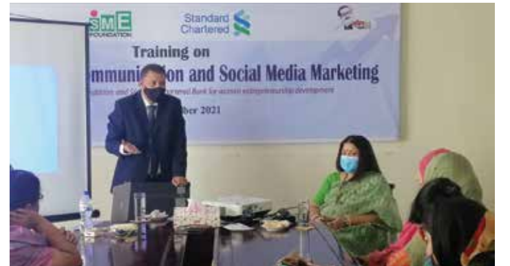
‘Online Business Communication & Social Media Marketing’ প্রশিক্ষণে আমন্ত্রিত অর্থাধিকারীদের সাথে উদ্যোক্তাগণ collaboration with partner financial institutions. কর্মসূচির আওতায় এমন ১০টি কর্মসূচি আয়োজনের পরিকল্পনা রয়েছে।

১৬-১৮ নভেম্বর ২০২১ সিলেটে নারী-উদ্যোক্তাদের জন্য ‘Online Business Communication & Social Media Marketing’ প্রশিক্ষণের আয়োজন করে এসএমই ফাউন্ডেশন। করোনা মহামারীর প্রেক্ষাপটে নারী-উদ্যোক্তাদের ব্যবসায়িক যোগাযোগের দক্ষতা উন্নয়নের অংশ হিসেবে সামাজিক যোগাযোগ মাধ্যম বিশেষতঃ নিজস্ব ওয়েবসাইট, ফেসবুক, লিংকডইন, টুইটার, ইন্সটাগ্রাম, গুগল এ মাই বিজনেস লিস্টিং ব্যবহার করে পণ্য বাজারজাতকরণ কৌশল, নতুন ব্যবসায়িক এটিকেটস, ব্যবসা পরিকল্পনা, প্রোডাক্ট প্রমোশনের জন্য প্রয়োজনীয় ব্যবস্থা গ্রহণ নিয়ে আলোচনা করা হয়। এছাড়া মহামারী পরবর্তী সময়ে উৎপাদিত পণ্য বিপণনের জন্য করণীয় ও বর্জনীয়সহ আধুনিক প্রযুক্তির লাগসই ব্যবহার নিশ্চিতকরণের মাধ্যমে ব্যবসায়ের প্রফিট ম্যাক্সিমাইজেশনের জন্য উদ্যোক্তাদের প্রয়োজনীয় দিক নির্দেশনা প্রদান করা হয়। প্রশিক্ষণে ৩০জন নারী-উদ্যোক্তা অংশগ্রহণ করেন। উল্লেখ্য, এসএমই ফাউন্ডেশনের নারী-উদ্যোক্তা উন্নয়ন উইং’র ২০২১-২২ অর্থবছরের কর্মপরিকল্পনায় Joint activities for women entrepreneurship development in