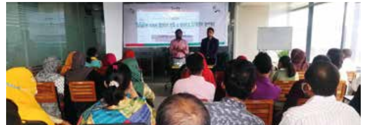
‘ডিজিটাল ব্যবসা উদ্যোগ সৃষ্টি ও ব্যবসায় ডিজিটাল রূপান্তর’ কর্মশালায় উদ্যোক্তাগণ

বর্তমান প্রেক্ষাপটে ব্যবসায় ডিজিটাল প্রযুক্তি ব্যবহার করা সময়ের চাহিদা। দেশে বেশ কিছু ডিজিটাল উদ্যোগ সফল হয়েছে এবং বহু কর্মসংস্থান সৃষ্টি হয়েছে। এরই প্রেক্ষাপটে এসএমই ফাউন্ডেশন ডিজিটাল উদ্যোক্তা তৈরির লক্ষ্যে সচেতনতামূলক কার্যক্রম গ্রহণ করেছে। পণ্যের কাঁচামাল সংগ্রহ থেকে শুরু করে পেমেন্ট, ব্যবসার সব স্তরে ডিজিটাল ট্রান্সফরমেশন করতে পারলেই বর্তমান প্রতিযোগিতার বাজারে ক্ষুদ্র ও মাঝারি উদ্যোক্তাদের টিকে থাকা সম্ভব। এসব প্রেক্ষাপট বিবেচনা করে ২৭ নভেম্বর ২০২১ ‘ডিজিটাল ব্যবসা উদ্যোগ সৃষ্টি ও ব্যবসায় ডিজিটাল রূপান্তর’ কর্মশালার আয়োজন করে এসএমই ফাউন্ডেশন।