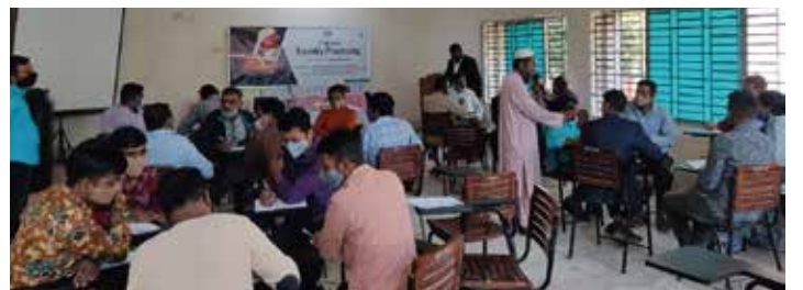
'Foundry Processing' প্রশিক্ষণে উদ্যোক্তাগণ

১৯-২১ নভেম্বর ২০২১ এসএমই ফাউন্ডেশনের উদ্যোগে বগুড়া লাইট ইঞ্জিনিয়ারিং ক্লাস্টারের উদ্যোক্তাদের 'Foundry Processing' প্রশিক্ষণ প্রদান করা হয়। বগুড়া'র বাংলাদেশ শিল্প কারিগরি সহায়তা কেন্দ্র (বিটাক)-এ অনুষ্ঠিত প্রশিক্ষণে উদ্যোক্তাদের ফাউন্ডিং মেল্টিং, মোল্টিং, কাস্টিং এবং ফাইনাল জব এর গুণগত মানোন্নয়ন বিষয়ে ব্যবহারিক প্রশিক্ষণ প্রদান করা হয়। প্রশিক্ষণের ৩য় দিন বাংলাদেশ শিল্প কারিগরি সহায়তা কেন্দ্র (বিটাক), বগুড়ার ফাউন্ডিং মেল্টিং এর বিভিন্ন পদ্ধতির পাশাপাশি মেল্টিং ও কাস্টিং দেখানো হয়। প্রশিক্ষণে বগুড়া লাইট ইঞ্জিনিয়ারিং ক্লাস্টারের ৩২জন উদ্যোক্তা অংশগ্রহণ করেন।