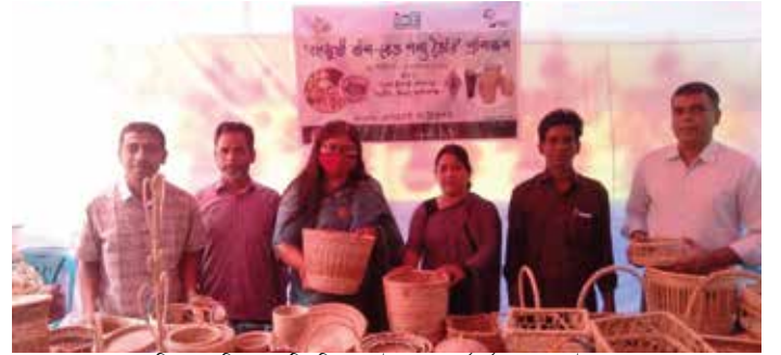
মানিকগঞ্জের ঘিওর একটি প্রশিক্ষণে ফাউন্ডেশনের কর্মকর্তাদের সাথে উদ্যোক্তাগণ

২২-২৪ নভেম্বর ২০২১ কুমিল্লায় 'বেকারি শিল্পে সঠিক উৎপাদন রীতি অনুশীলন' প্রশিক্ষণের আয়োজন করে এসএমই ফাউন্ডেশন। প্রশিক্ষণে ব্যক্তিগত পরিচ্ছন্নতা, কারখানার পরিবেশ, যন্ত্রপাতি ও কাঁচামাল ব্যবহার, সংগ্রহ ও উৎপাদিত পণ্য সংরক্ষণ পদ্ধতি, কীটপতঙ্গ দমন, সর্বোপরি নিরাপদ উপায়ে খাদ্য উৎপাদন পদ্ধতি বিষয়ে অংশগ্রহণকারীদের প্রাথমিক ধারণা প্রদান করা হয়। প্রশিক্ষণে বিএসটিআই-এর