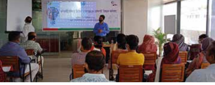
‘এসএমই ব্যবসায় উদ্ভাবন: COVID-19 প্রেক্ষাপট’ কর্মশালায় অংশগ্রহণকারী উদ্যোক্তাগণ

বৈশ্বিক বাজারে প্রতিযোগিতায় সফল হতে ও তা ধরে রাখতে প্রয়োজন নতুনত্ব ও উদ্ভাবন। উদ্ভাবন হচ্ছে সফল ব্যবসার চাবিকাঠি। ব্যবসায় সফল হওয়ার জন্য পণ্য এবং বাজার সম্পর্কে নতুন কিছু উদ্ভাবন করা বর্তমান করোনা পরিস্থিতিতে আরো বেশি গুরুত্বপূর্ণ হয়ে উঠেছে। বর্তমান প্রেক্ষাপটে উদ্যোক্তাদের ব্যবসায় উদ্ভাবন আনয়নে ০৯ অক্টোবর ২০২১ ইনস্টিটিউট অব এসএমই ফাউন্ডেশনে ‘এসএমই ব্যবসায় উদ্ভাবন: কোভিড-১৯ প্রেক্ষাপট’ কর্মশালায় আয়োজন করা হয়। কর্মশালায় ব্যবসায় উদ্ভাবন সংক্রান্ত বিভিন্ন বিষয় উপস্থাপন করা হয় এবং উদ্যোক্তাদের ব্যবসায় উদ্ভাবন করার বিষয়ে পর্যালোচনা ও দিক নির্দেশনা প্রদান করা হয়। এতে ৩০জন উদ্যোক্তা অংশগ্রহণ করেন।