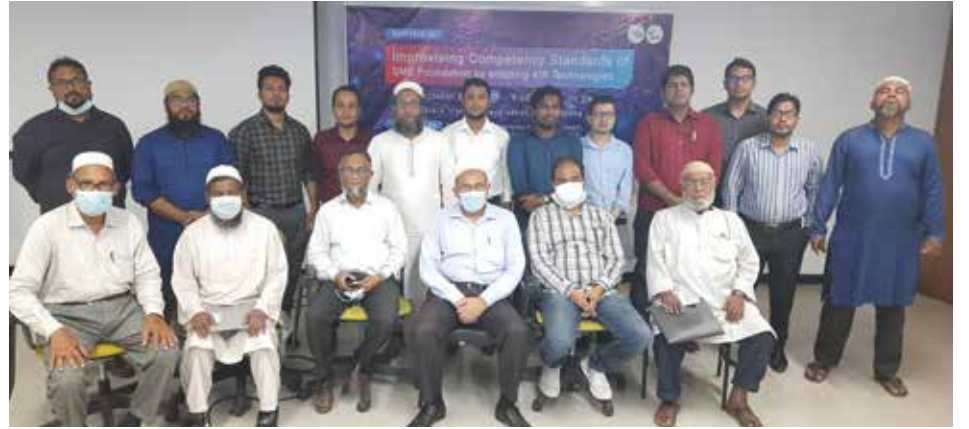
‘Improving Competency Standard of SME Foundation by adapting 4IR Technologies’ কর্মশালায় অংশগ্রহণকারী অতিথিবৃন্দের একাংশ

এসএমই ফাউন্ডেশনের উদ্যোগে এবং এসপায়ার টু ইনোভেট (এটুআই) প্রোগ্রামের কারিগরি সহযোগিতায় ২৩ অক্টোবর ২০২১ কৃষিবিদ ইন্সটিটিউট বাংলাদেশ, ঢাকায় ‘Improving Competency Standard of SME Foundation by adapting 4IR Technologies’ কর্মশালা অনুষ্ঠিত হয়। মন্ত্রিপরিষদ বিভাগের নির্দেশনায় এবং এটুআই প্রোগ্রামের সহযোগিতায় এসএমই ফাউন্ডেশন কর্তৃক গৃহীত ‘SME SHIFT: Skills for High Impact Future Technology’ পাইলট প্রকল্পের আওতায় উক্ত কর্মশালা আয়োজন করা হয়। কর্মশালায় বাংলাদেশ কারিগরি শিক্ষা বোর্ড-এর কর্মকর্তাগণ দক্ষতা উন্নয়নমূলক প্রশিক্ষণের জন্য বিদ্যমান জাতীয় ফ্রেমওয়ার্ক অনুসারে Competency Standard প্রণয়নের ওপর প্রজেক্টেশন প্রদান করেন। ফাউন্ডেশনের বিদ্যমান ২টি কোর্সের Competency Standard ৪র্থ শিল্প বিপ্লবের প্রযুক্তি ও কলাকৌশলের আলোকে পরিমার্জন করে প্রণীতব্য Foundry Molding-4.0 এবং Heat Treatment-4.0 কোর্সের Unit of