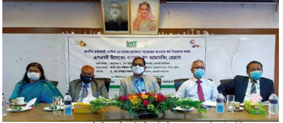
প্রণোদনা প্যাকেজ বাস্তবায়নে এসএমই ফাউন্ডেশনের উদ্যোগে সিলেটে আয়োজিত উদ্যোক্তা-ব্যাংকার- ম্যাচমেকিং অনুষ্ঠানে অর্থাধিকার

১৭ নভেম্বর ২০২১ রংপুরে এসএমই ফাউন্ডেশনের উদ্যোগে আয়োজিত এসএমই উদ্যোক্তা-ব্যাংকার ঋণ ম্যাচমেকিং অনুষ্ঠানে ফাউন্ডেশনের