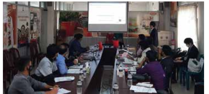
‘Management Capacity Development’ প্রশিক্ষণে অংশগ্রহণকারী উদ্যোক্তাগণের একাংশ

শিল্প মন্ত্রণালয়ের তত্ত্বাবধানে জাপান ইন্টারন্যাশনাল কোঅপারেশন এজেন্সি (জাইকা)-র সহায়তায় দেশের রপ্তানিমুখী ও সম্ভাবনাময় এসএমই উদ্যোক্তাদের উন্নয়নে ‘The Project for Promoting Investment and Enhancing Industrial Competitiveness’ শীর্ষক একটি প্রকল্প শিল্প মন্ত্রণালয়, এসএমই ফাউন্ডেশন ও বাংলাদেশ শিল্প কারিগরি সহায়তা কেন্দ্র (বিটাক) যৌথভাবে বাস্তবায়ন করছে। প্রকল্পের আওতায় দেশের প্লাস্টিক, হালকা প্রকৌশল, ইলেকট্রিক্যাল এবং ইলেকট্রনিক্স শিল্প খাতের উদ্যোক্তাদের দক্ষতা ও সক্ষমতা উন্নয়ন এবং আমদানি-বিকল্প পণ্য উৎপাদন ও বিদেশি প্রতিষ্ঠানের সাথে সংযোগ স্থাপনের মাধ্যমে রপ্তানিমুখী পণ্য উৎপাদনে বিভিন্ন কর্মসূচি বাস্তবায়ন করা হচ্ছে। তার অংশ হিসেবে ১৩-১৪ ডিসেম্বর ২০২১ ‘Management Capacity Development’ ৬ষ্ঠ ব্যাচের প্রশিক্ষণ আয়োজন করা হয়। এতে আন্তর্জাতিক মানের মডেল প্রোডাকশন লাইন ও কোয়ালিটি কন্ট্রোল সম্পর্কে প্রশিক্ষণার্থীদের ধারণা প্রদান করা হয়। প্রথম দিনে প্রশিক্ষণার্থীরা গাজীপুরে বেঙ্গল পলিমার ওয়ারস-এ স্থাপিত আন্তর্জাতিক মানের মডেল প্রোডাকশন লাইন সরেজমিন পর্যবেক্ষণ করেন। দ্বিতীয় দিনে প্রশিক্ষণার্থীরা কোয়ালিটি কন্ট্রোল সম্পর্কে ধারণা লাভ করেন।