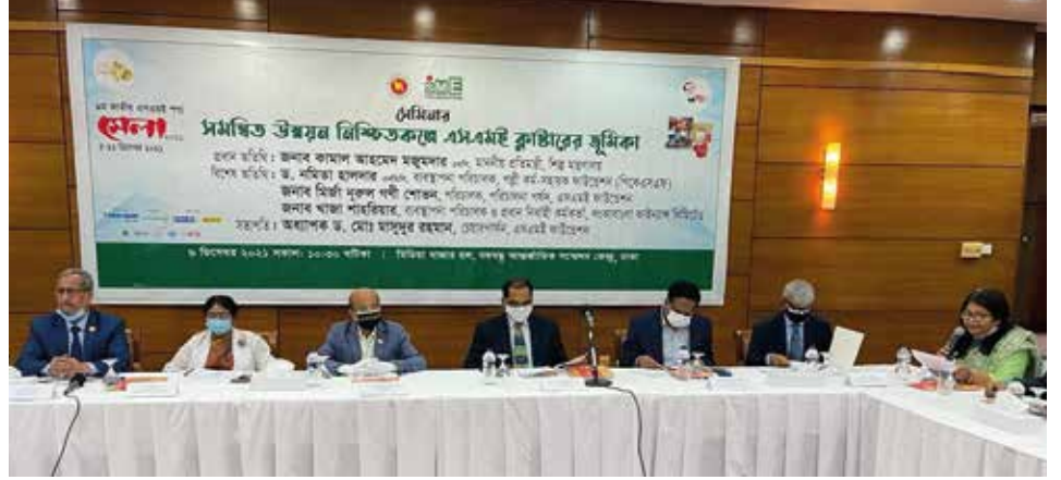
‘সমন্বিত উন্নয়ন নিশ্চিতকল্পে এসএমই ক্লাস্টারের ভূমিকা’ সেমিনারে শিল্প প্রতিমন্ত্রী কামাল আহমেদ মজুমদার এমপি ও অন্যান্য অতিথিবৃন্দ