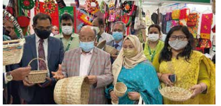
৯ম জাতীয় এসএমই পণ্যমেলায় এসএমই ক্লাস্টার উদ্যোক্তাদের পণ্য পরিদর্শন করেন শিল্পমন্ত্রী