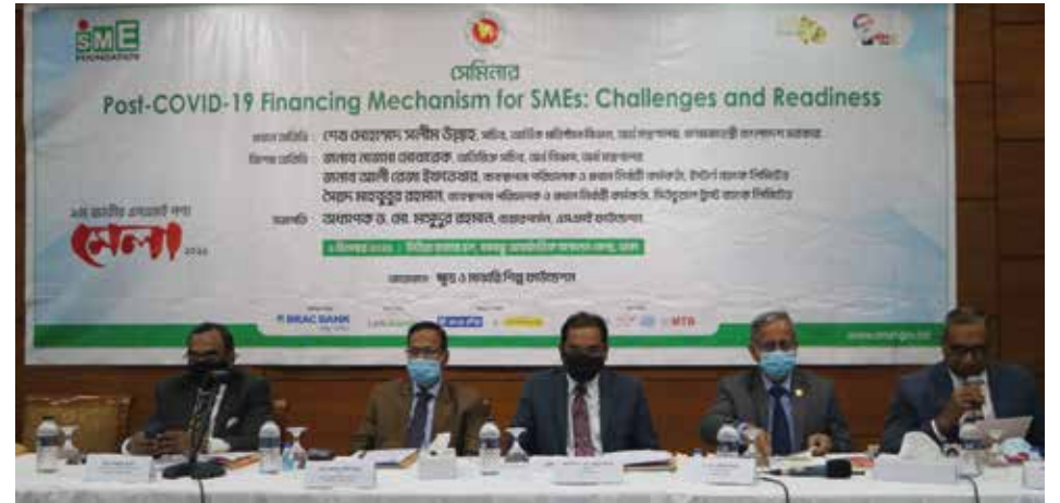
‘Post-COVID 19 Financing Mechanism for SMEs: Challenges and Readiness’ সেমিনারে অতিথিবৃন্দ