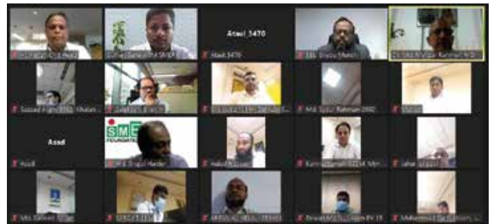
অনলাইনে আয়োজিত ব্যাংক ও আর্থিক প্রতিষ্ঠানের কর্মকর্তাদের সাথে আলোচনা সভায় অংশগ্রহণকারীদের একাংশ