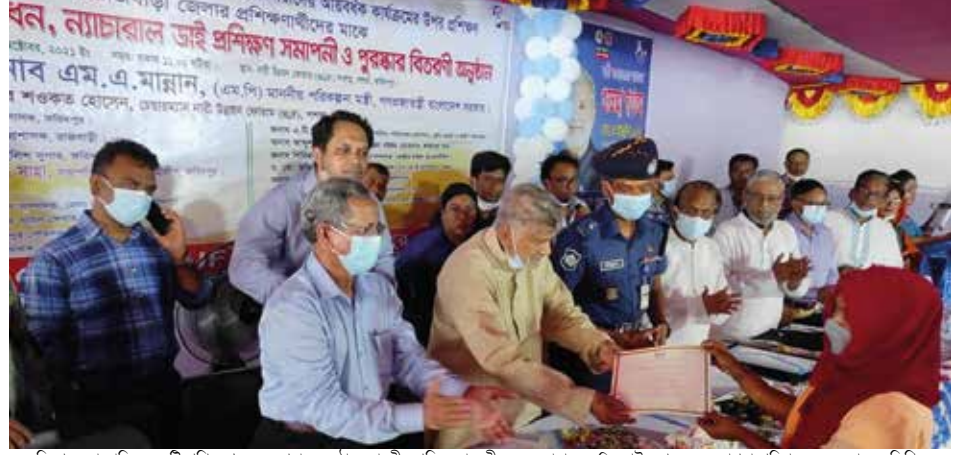
ফরিদপুরে আয়োজিত একটি প্রশিক্ষণের সনদ প্রদান অনুষ্ঠানে মাননীয় পরিকল্পনা মন্ত্রী এম এ মান্নান এমপি, ফাউন্ডেশনের ব্যবস্থাপনা পরিচালক ও অন্যান্য অতিথিবৃন্দ

স্থানীয় ও আন্তর্জাতিক বাজার প্রতিযোগিতায় এসএমই উদ্যোক্তাদের টিকে থাকার সক্ষমতা বৃদ্ধির লক্ষ্যে ঢাকায় 'বহুমুখী চামড়া জাত পণ্য তৈরি ও বিপণন'